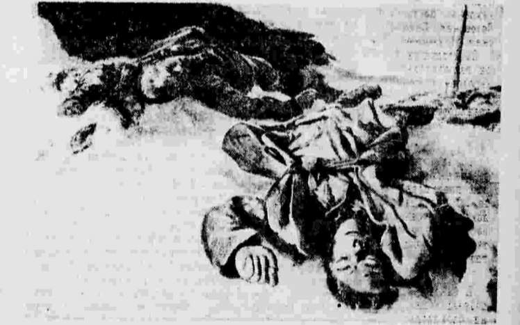
Фотодокументы о зверствах немцев в хуторе Вертячем

обрекали их на голодную смерть. Из 89 советских военнопленных, находившихся в лагере на хуторе Вертячем, умерло от голода, замучено и расстреляно 87 человек.