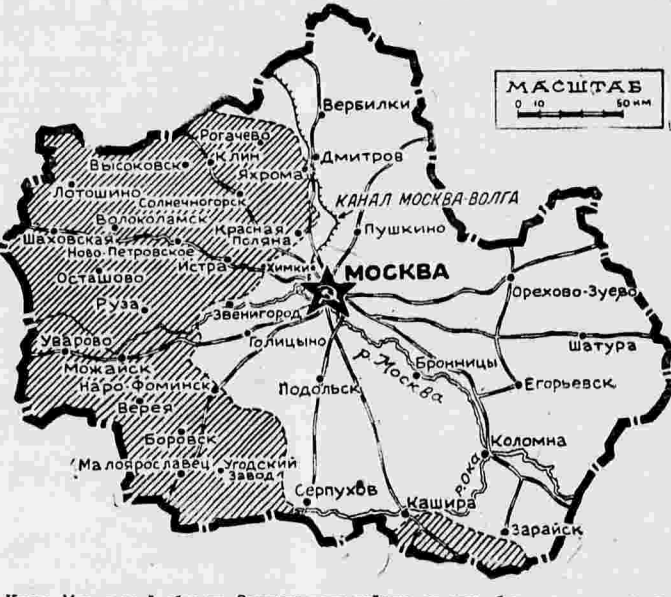
Карта Московской области. Зашированы районы, которые были временно захвачены немецкими оккупантами, а сейчас освобождены Красной Армией.