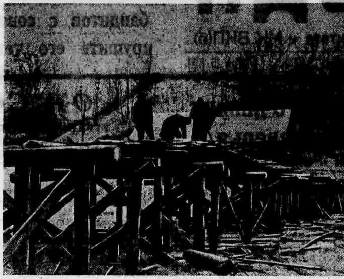
Восстановление разрушенного немцами моста в гор. Верее.